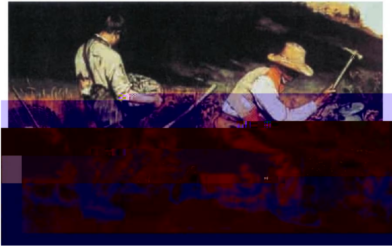
石工 (油画, 1849年) 库尔贝 (法国)